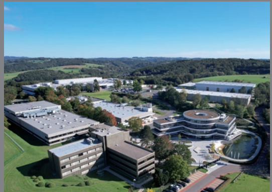
SARSTEDT, siège social incluant la production à Nümbrecht, Allemagne.